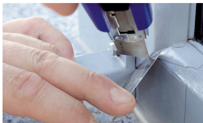
6. Finition des chants

Tout savoir sur la rénovation des films : devenez rapidement spécialiste en réparation grâce à la formation par des experts RENOLIT .