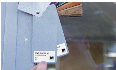
1. Sélection du film correspondant

Après une formation chez RENOLIT, vous serez en mesure de réparer des défauts sur des films de revêtement de profilés en moins de temps qu'il n'en faut pour le dire.